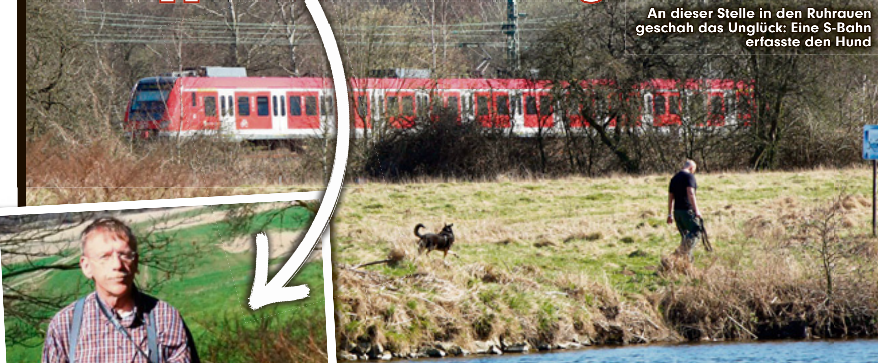
An dieser Stelle in den Ruhrauen geschah das Unglück: Eine S-Bahn erfasste den Hund