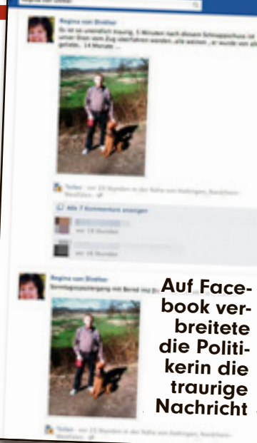
Auf Facebook verbreitete die Politikerin die traurige Nachricht